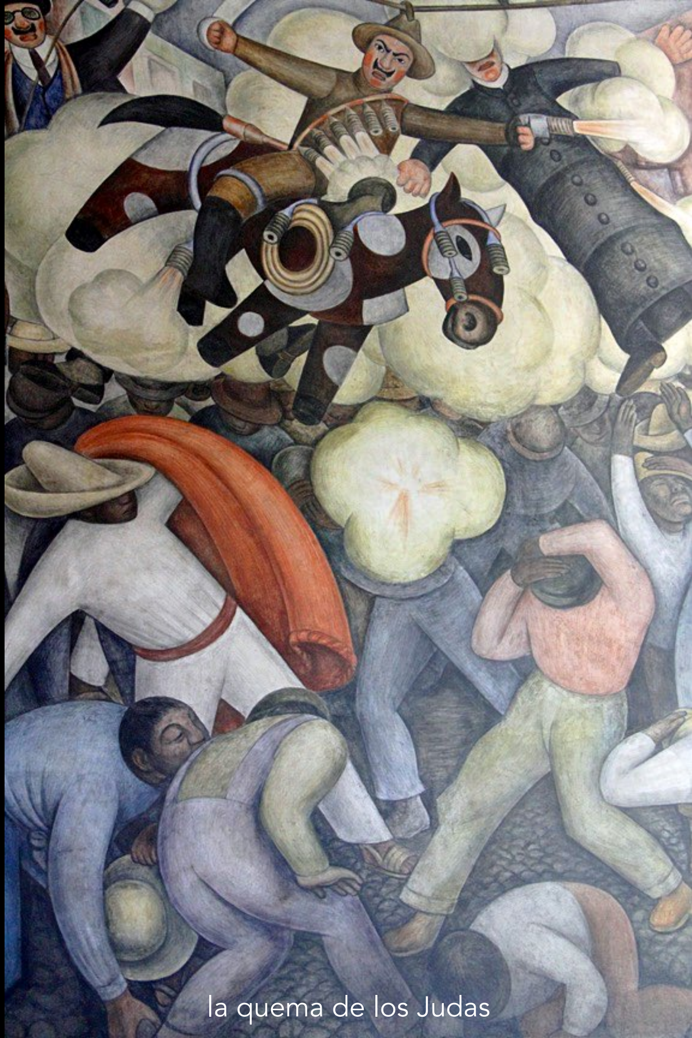
la quema de los Judas