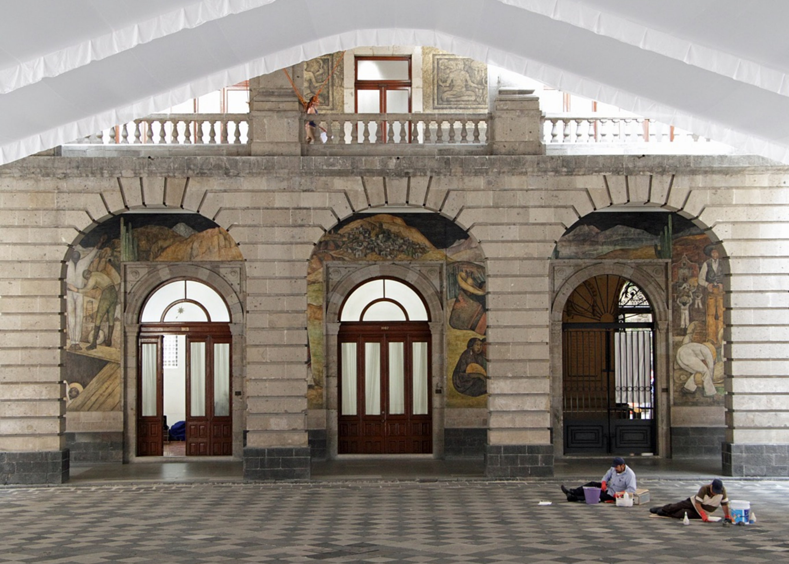
Secretaría de Educación Pública