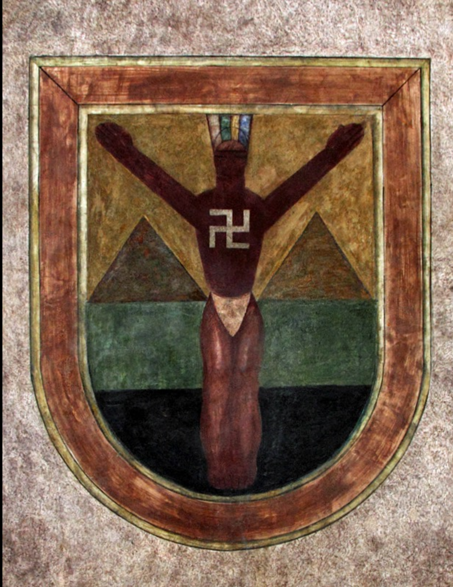
escudo de armas del estado de Sonora