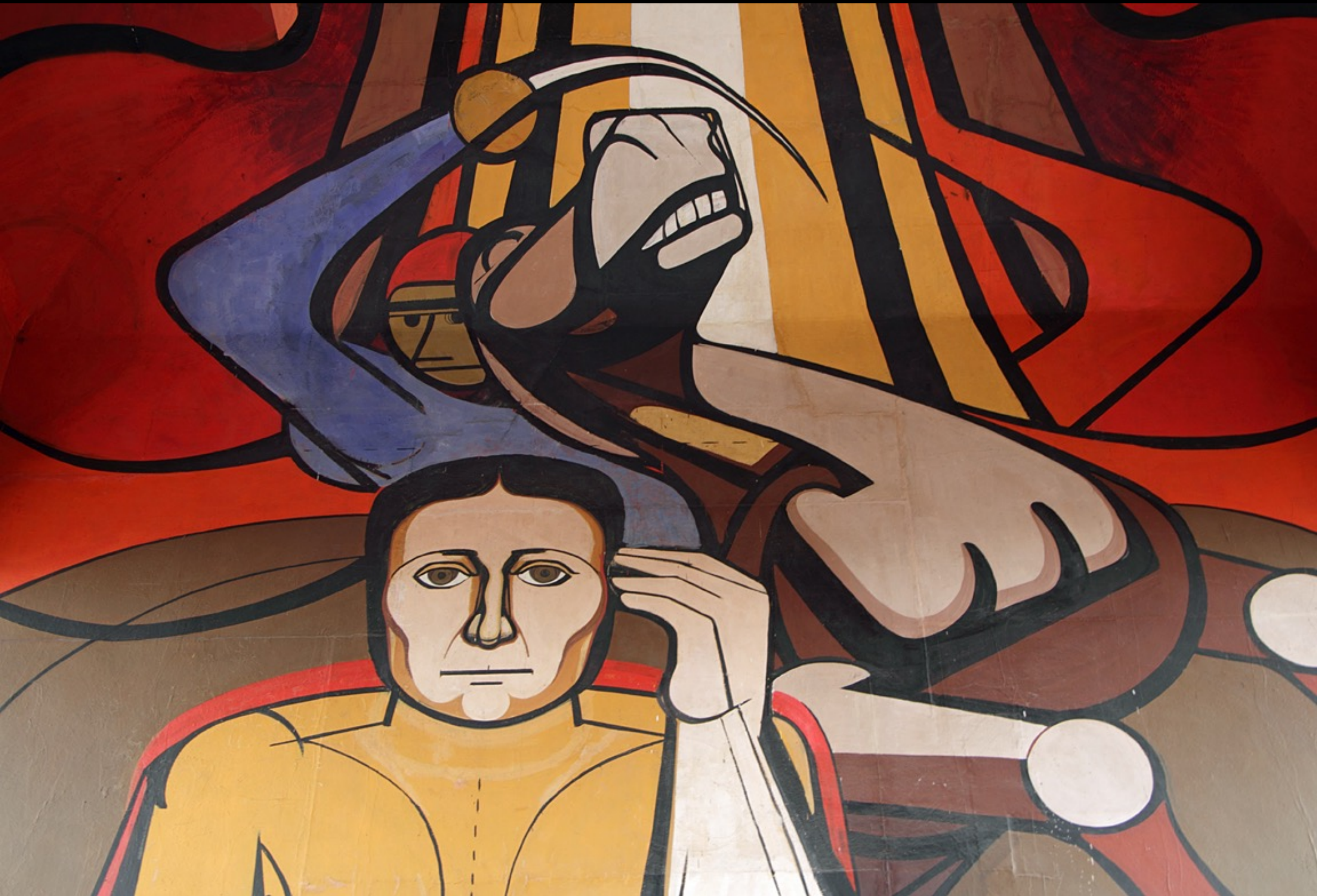
David Alfaro Siqueiros