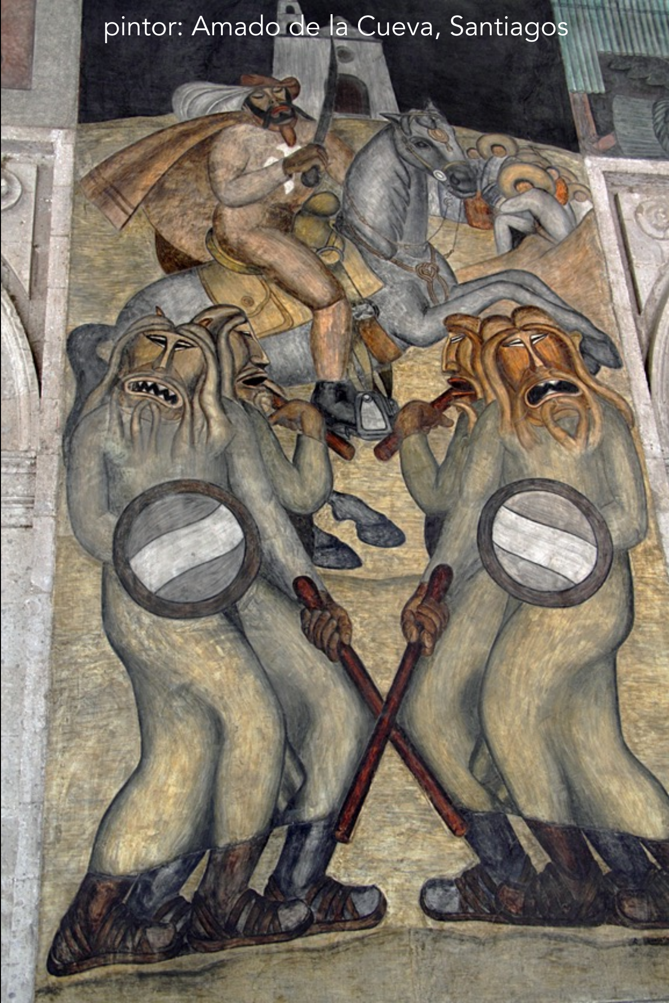
pintor: Amado de la Cueva, Santiagos