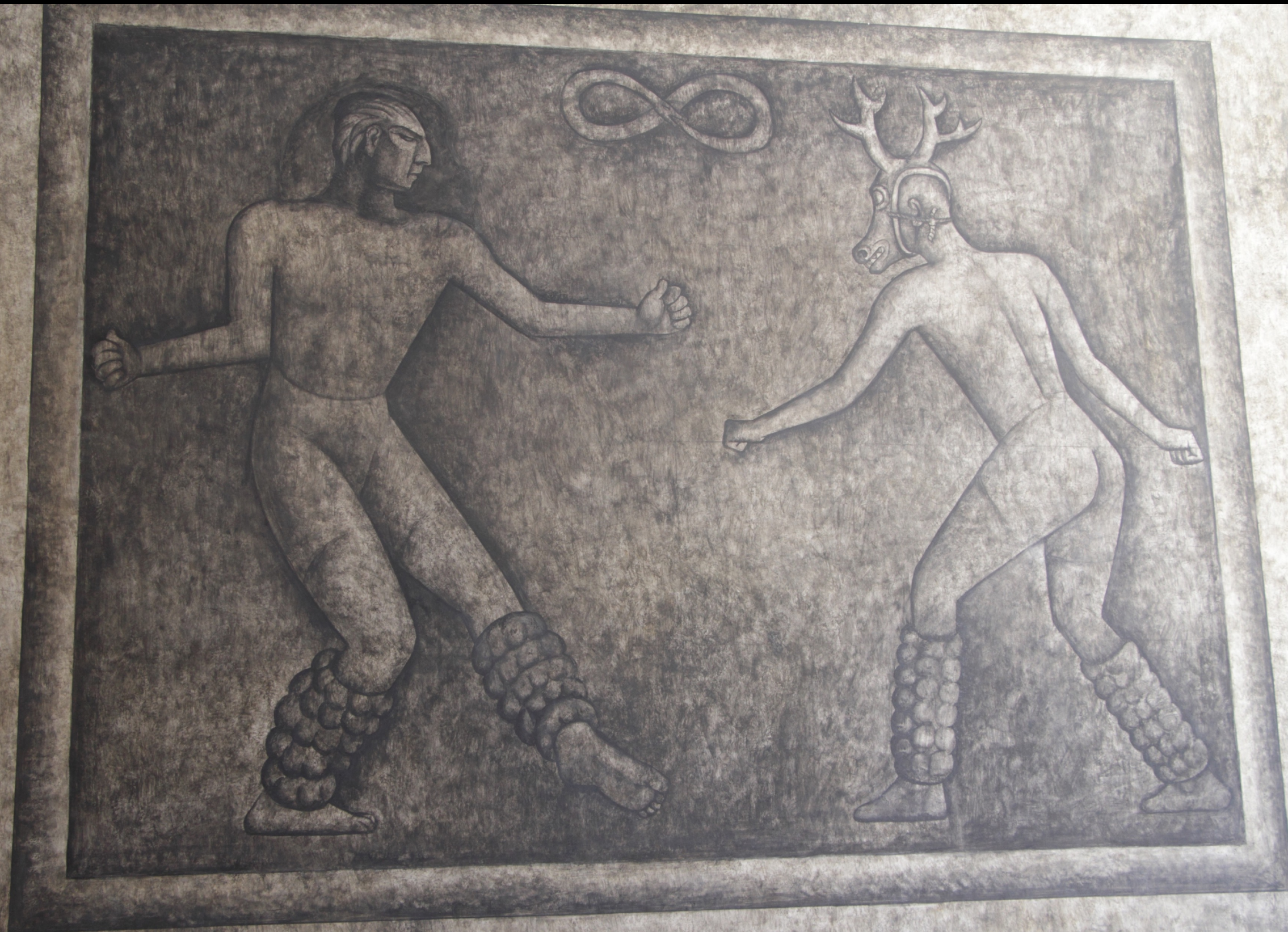
tercero piso, Danza del Venadito