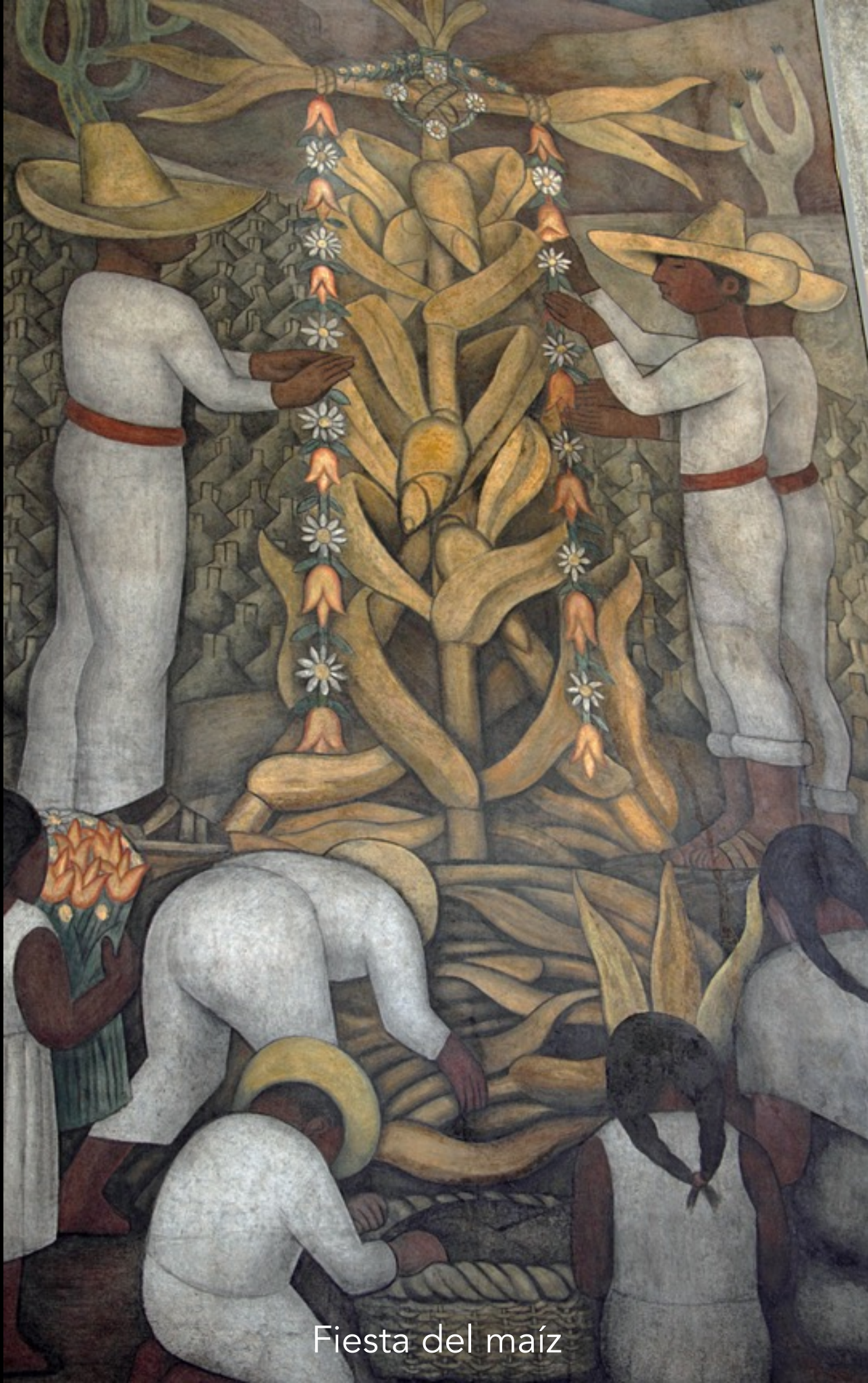
Fiesta del maíz