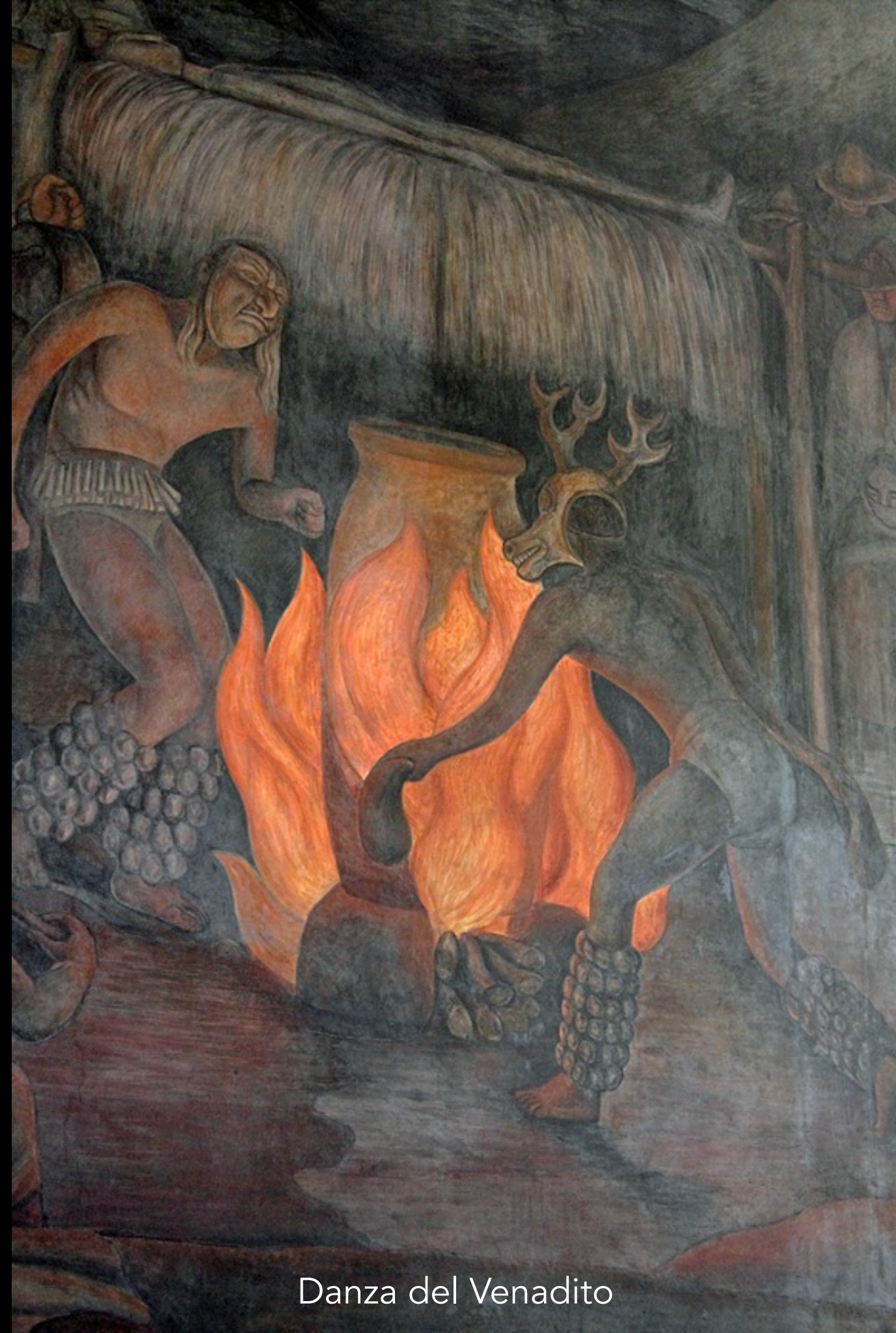
Danza del Venadito