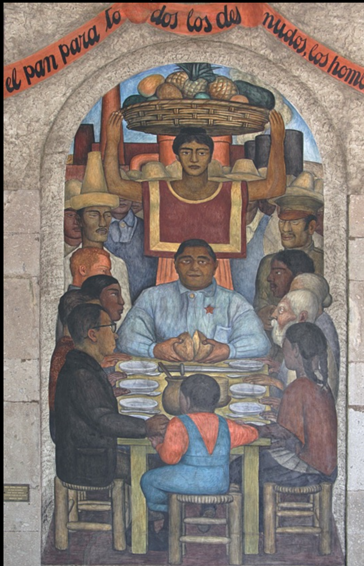
el pan nuestro