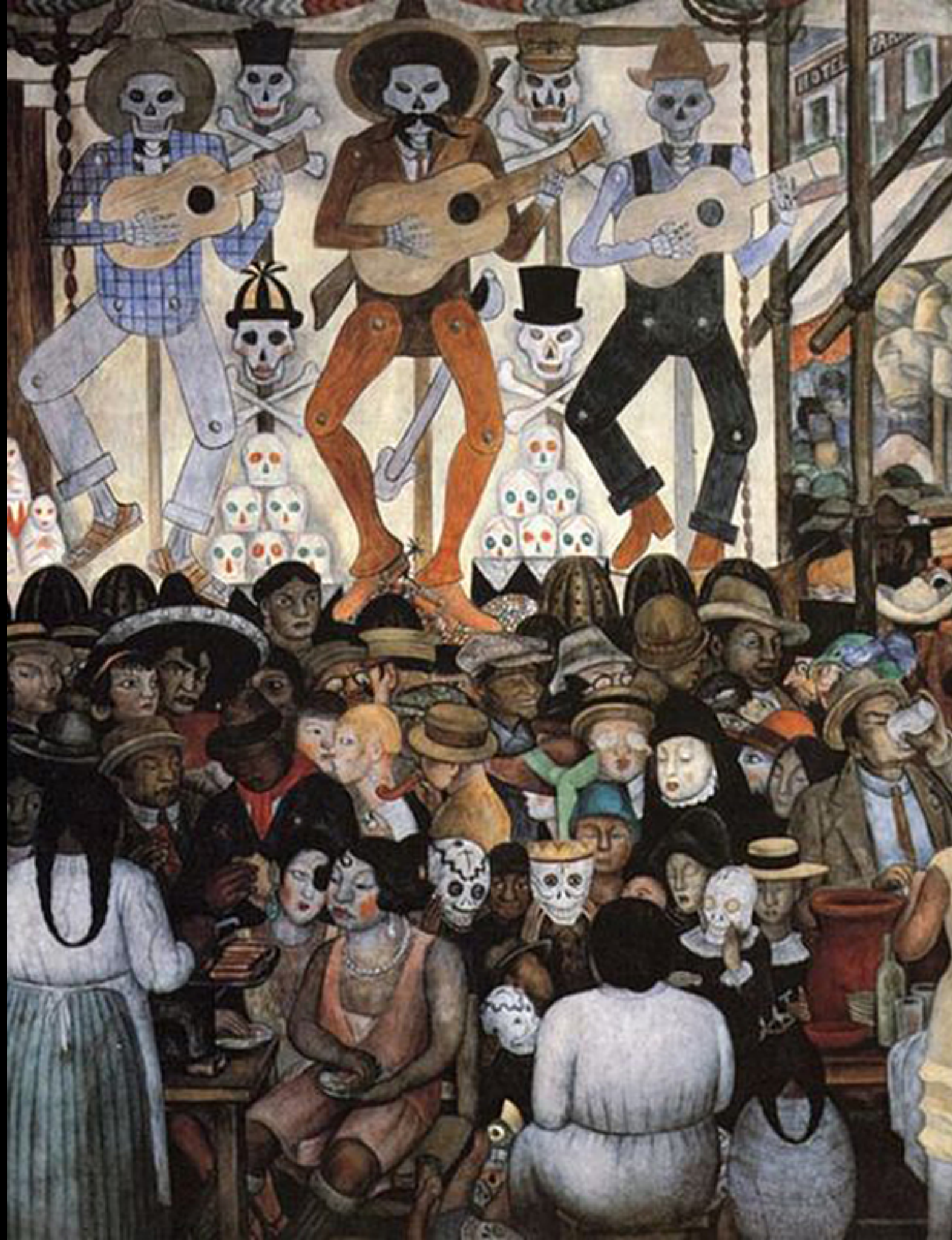
Día de muertos